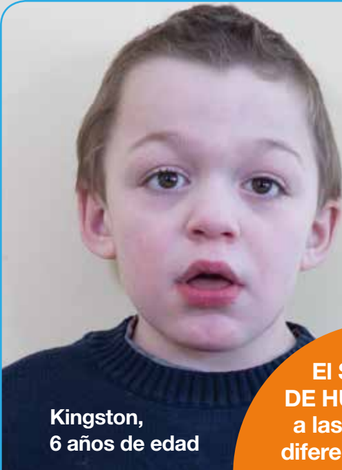
Kingston, 6 años de edad