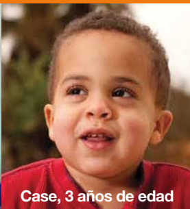
Case, 3 años de edad

Las personas con síndrome de Hunter pueden parecer normales al nacer, pero con el tiempo los síntomas comienzan a aparecer y a empeorar. Entre los 2 y los 4 años de edad, se puede observar un conjunto de algunos de los síntomas que se enumeran a continuación: 1